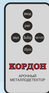
Пульт дистанционного управления.